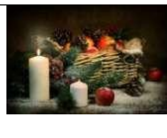
А) Новый год